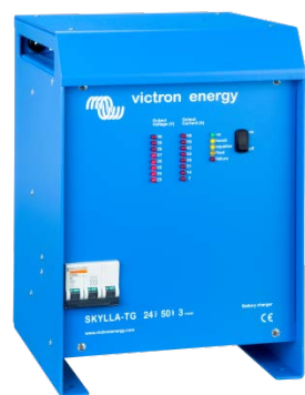
Skylla TG 24 50 3 phase

Pro lepší seznámení s bateriemi a jejich nabíjením, doporučujeme přečíst si naši publikaci „Energie bez hranic“ (Je k dispozici zdarma od Victron Energy nebo jí lze stáhnout z www.victronenergy.com ).