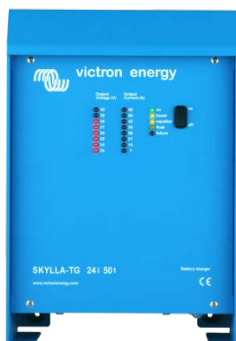
Skylla TG 24 50