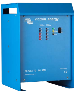
Skylla TG 24 100